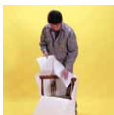
Übersee- verpackung und Umzüge