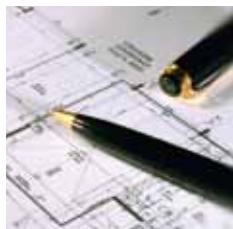
Planung und Consulting