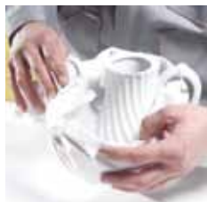
Packer-, Montage- und Reinigungs- arbeiten