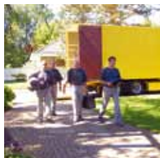
Privat- und Senioren- umzüge